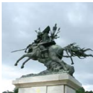
菊池市民広場 / 約10mもの大きさがある菊池武光公の騎馬像が設置され、菊池のシンボルとなっている公園です。敷地内には、菊池観光物産館や足湯があります。