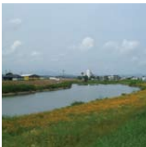
菊池川河川敷 / 四季折々の花と川の調和が楽しめる七城地域の川沿い!絶景スポットです。10月頃には、コスモスとひまわりの同時開花も見る事ができます。