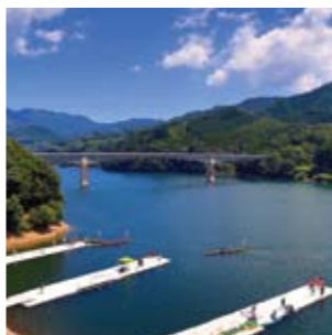
龍門ダム / ダム湖をぐるりと囲む斑蛇口湖公園は、散策や釣りを楽しむのに最適!坂道を登りつめたあと、ゆったりと広がる湖は、癒しのスポットです。