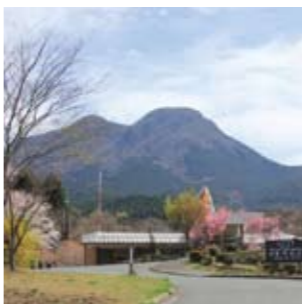
四季の里旭志 / 四季折々の花々と数岳中腹から見渡せる菊池平野の広大な自然が楽しめる標高500mに位置する温泉施設。天気よければ有明海が一望できます。