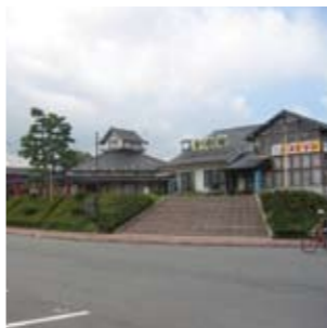
道の駅旭志 旭志村ふれあいセンター / とろけるような肉質のブランド牛「旭志牛」をメインに取り扱う物産館。旭志牛を使った惣菜、ランチなど也大変好評です。テイクアウトOK。