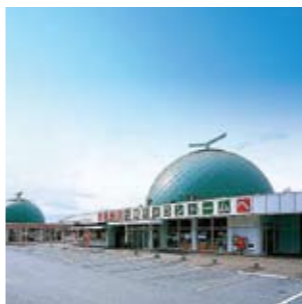
七城メロンドーム / メロンの形をした外観が特徴的な道の駅で、名前のとおりメロンやメロンを使った加工品を主に販売しています。レストランも併設。