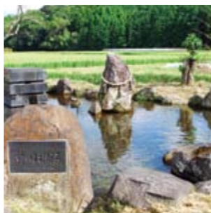
前川水源(亀尾城址公園) / 熊本名水百選に選ばれ湧き水で水分補給が出来る休憩スポット。(芝生あり)菊池十七外城のひとつ亀尾城があったところで、池には水車が回っています。