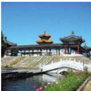
孔子公園 / 中国宮廷建築様式の公園。隣接する道の駅酒肴養生市場でお弁当を買ってピクニックもおすすです。毎年8月14日「しずい孔子公園夏まつり」。