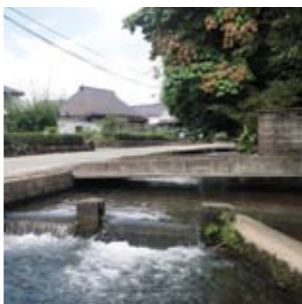
赤星井出 / 加藤清正公の時代に築造された井出で広々とした田園風景が広がる赤星、出田地域の水田を潤しています。