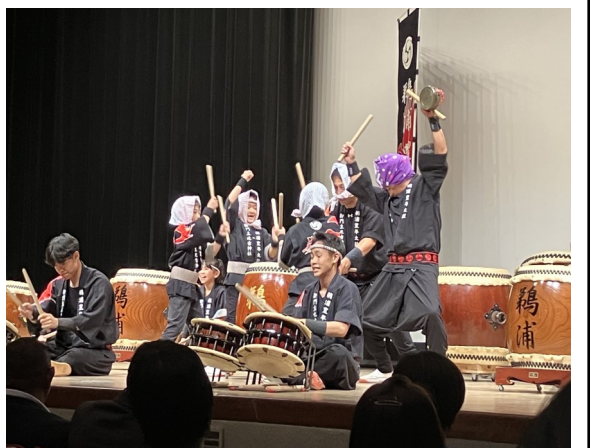
オープニングアトラクションの鶏浦太鼓