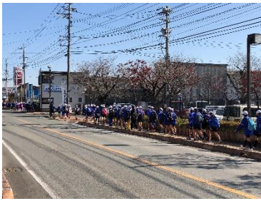
限府小前を市民広場へ向かって歩く5、6年生

〇一、二年生：カントリーパーク 〇三、四年生：七城鴨川河川公園 〇五、六年生：菊池市民広場 学年の発達段階に応じて、往復約9km、十八kmの目的地を設定して挑戦しました。素晴らしい晴天に恵まれて、途中は暑いくらいでしたが、参加した児童は一人の脱