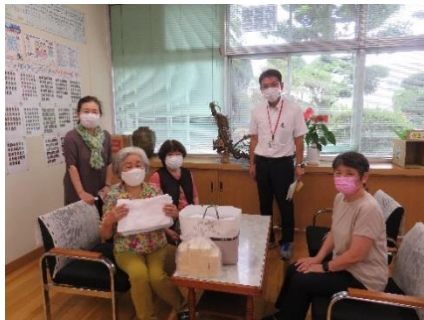
むつみ会の代表の皆様

前期前半が終了します。本年度も、新型コロナウイルス感染拡大防止対策を念頭に置いた学校運営に迫られ、授業参観・PTA総会の中止及び紙面開催、運動会の延期など、保護者の皆様に大変ご心配とご迷惑をおかけしました。そんな中でも、学校の教育活動に対して、ご理解とご協力をいただき、本当にありがとうございます。 さて、いよいよ明後日から夏休みです。児童はとも楽しみにしていると思います。引き続き新型コロナウイルス感染症防止の取組を続けるとともに、楽しい思い出をつくらせてほしいと思います。 そして、七月二十三日(金)には、東京オリンピック・パラリンピックが開幕します。コロナ禍での開催ということで、様々なご意見もあります。オリンピックに人生をかけてきたアスリートの姿に学ぶことも多いと思います。テレビを通してとはなりますが、児童に多くの感動を味わわせていただけたらと思います。 それでは、八月二十五日(水)、児童がひと回り成長し、元気な姿で登校してくれることを楽しみにしています。