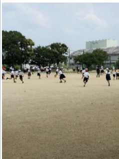
6月24日(木) スポーツ委員会 「鬼ごっこ」

早いもので前期前半も残りあと一ヶ月となりました。望ましい生活習慣で、学習のまとめがしっかりとできるよう、ご家庭での支援をお願いします。 なお、延期している運動会は、十月二十三日(土)午前中に開催します。