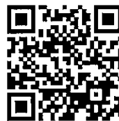
【読書バリアフリーについて】