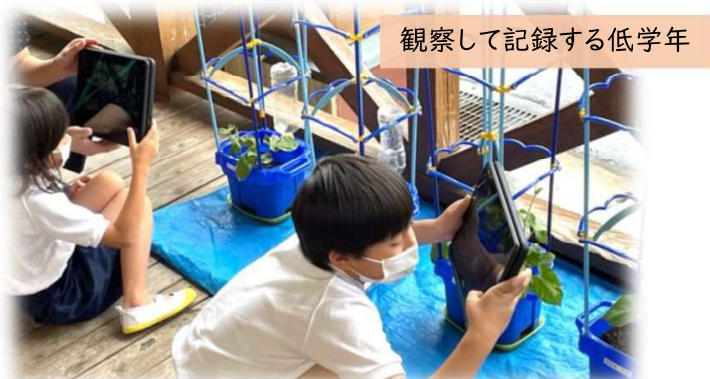
観察して記録する低学年

同校では、日常的に、子供たちも先生たちもICTを「普段使い」する姿がたくさん見られ、ICT活用を通じた、新たな学びが展開されています。