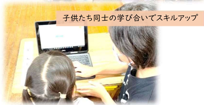
子供たち同士の学び合いでスキルアップ

学校情報化認定「優良校」の取得数: 207校 (市町村立学校186校、県立学校21校)