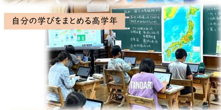
自分の学びをまとめる高学年