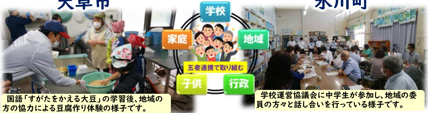
国語「すがたをかえる大豆」の学習後、地域の方の協力による豆腐作り体験の様子です。