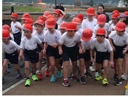
1・2・3年生のスタート