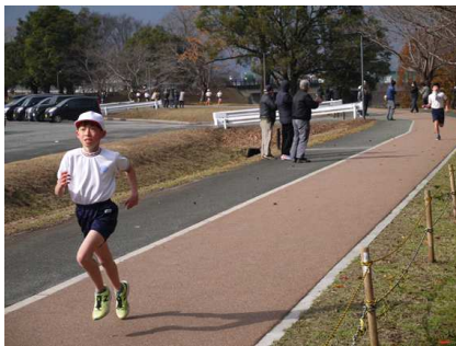
強い風にも負けず走る児童

12月17日(金)に行ないました校内持久走大会におきましては、ご多用な中多くの保護者の方々や学校運営協議会を中心とする地域の方々にご参観いただきましてありがとうございます。今年度は、安全面を考慮して、学校周辺のコースから七城町の鴨川河畔公園に場所を移しての開催になりました。当日は強い北風が吹き荒れる寒い日になりましたが、子どもたちは、それまでの練習の成果を十分に発揮して素晴らしい記録を残すことができました。残念ながら大会新記録は出ませんでした。自分の記録を更新することができた子どもたちが多くいました。この大会を開催するにあたり、PTAの体育委員の皆様をはじめ、学校運営協議会の皆様には、多くのご支援、ご協力をいただきました。心より感謝申し上げます。