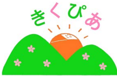
菊池市子育て世代包括支援センター