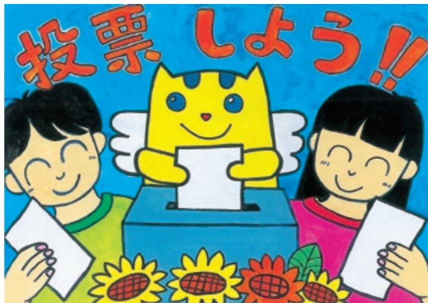
平成21年度明るい選挙啓発ポスターコンクール 財団法人明るい選挙推進協会会長賞、都道府県選挙管理委員会連合会会長賞

菊池遺産は、古来より大切に守り続けられてきた身近な地域の宝物から、学術的価値や芸術的価値を有する指定文化などを含めた、広い範囲のものを認定しています。 その大きな菊池遺産の中を分類するため、国、県、市といった指定などがあるものを「特別遺産」とし、地域で大切にされているようなものを「ふるさと遺産」として分類しています。