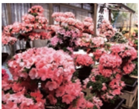
上：たくさんのサツキとバラの鉢が並ぶ庭 右：今年からやまめの養殖を始めたそうですが、自分では愛着が湧いてあまり食べず、人にあげてばかりだそうです

もいいからはっきり大事なところを書いてほしい。質問次第では長くなっても詳しく書くべきだと思う。そうじゃなければ市民には伝わらない」と続けます。