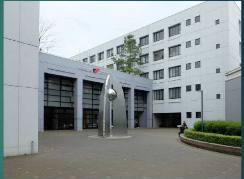
熊本県立大学 環境共生学部