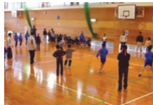
昨年の大会から(ドッチビー)

きれいな球体ではないふらばーボールを使ったバレーボールです。相手からきたボールをバウンドさせてから3回で返します。