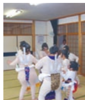
出前講座の「相撲甚句」

秋祭り時期に、豊岡地区から出前講座の依頼があり邦楽の一種である「相撲甚句」を行いました。これは力士6、7人が輪になり1人ずつで唄われる力士独特の唄で、その歌を歌いながら土俵入りのしぐさを真似ています。昨年開催された「第18回豊岡ふるさと祭り」では、受講者による「相撲甚句」が披露されました。練習の成果もあり、区民の皆さんも「とても良かったです」と喜んでいました。同地区在住の徳洲体指は、親子三代での出演でした。