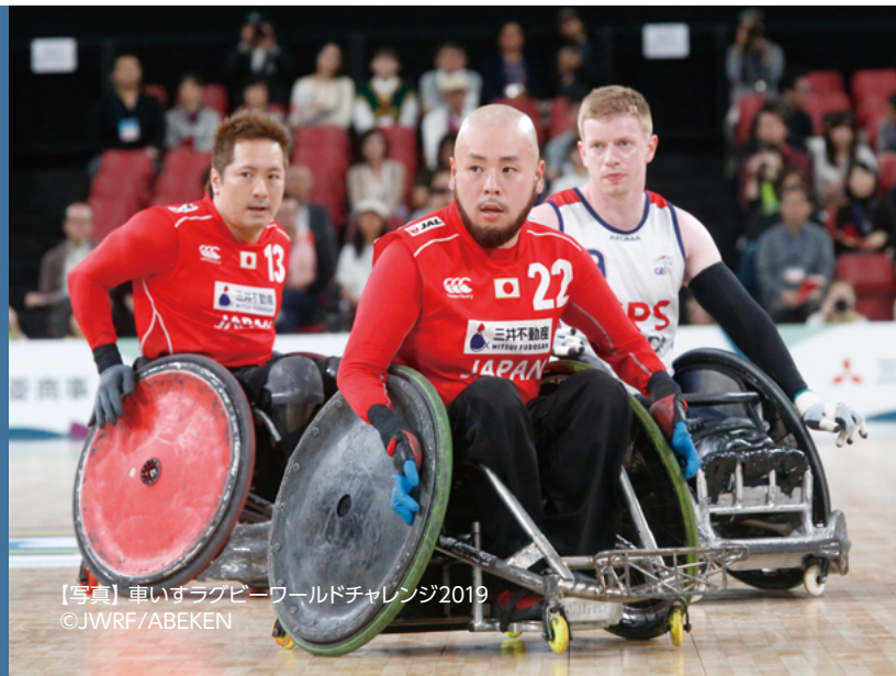
【写真】車いすラグビーワールドチャンピオンシップ2019