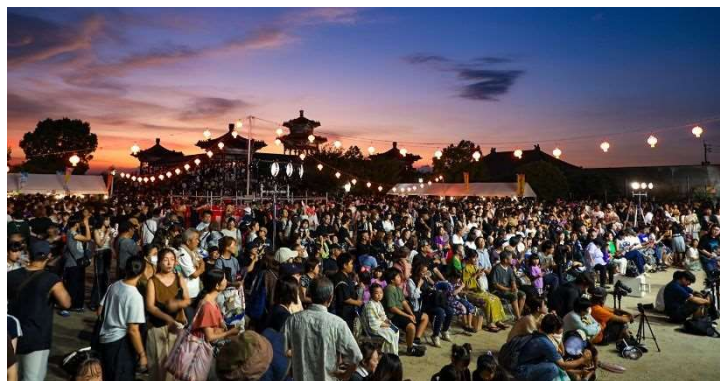
令和 7 年度の様子