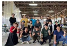
【きくちみらいマルシェ vol 1】