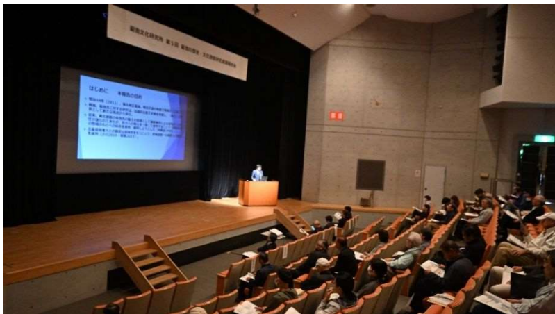
令和 7 年度成果報告会の様子