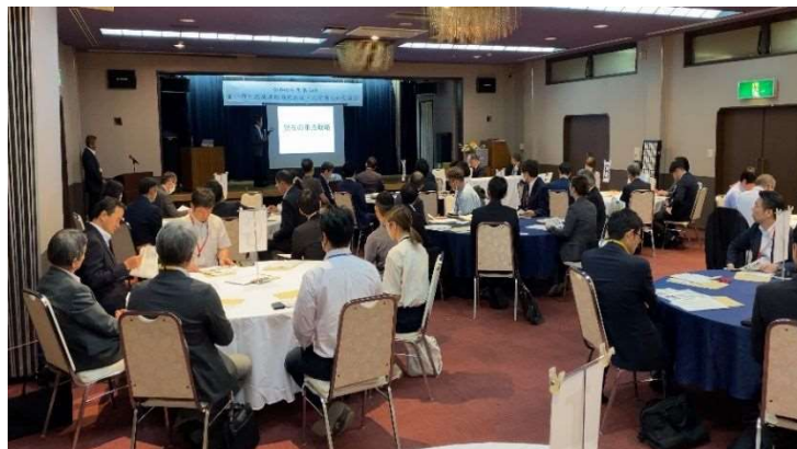
前回（令和6年度）の様子