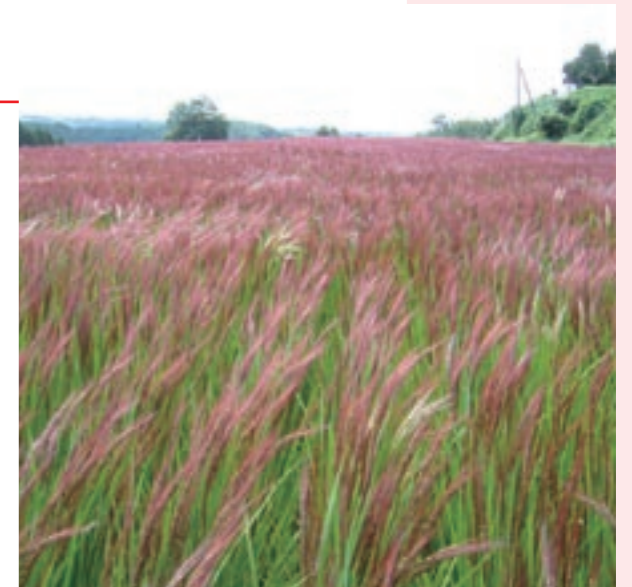
9月中旬に、鮮やかな赤色の稲穂をつけた「赤米」

古代米は、原種に近いもち米で、通常の稲に比べ病害虫に強い。減農薬・無化学肥料での栽培が行いやすく、菊池市農林振興課農政係では、今後、無農薬・無化学肥料での栽培も計画されるなど、安全・安心の農作物づくりや食を通じた健康づくりにも繋がるものと考えています。