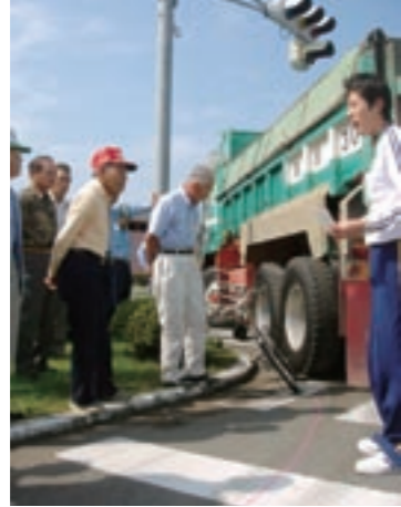
真剣に説明を聞く参加者たち