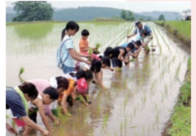
6月25日（日）にあった「古代米」の体験田植え