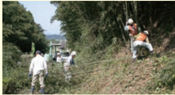
道路沿いの草刈作業をボランティアで行う菊池市建設業協会（旭志地区）のメンバー

これは、日頃お世話になっている地域の皆さんが安全に道路を通行できるようにとの思いから、毎年この時期に行われています。