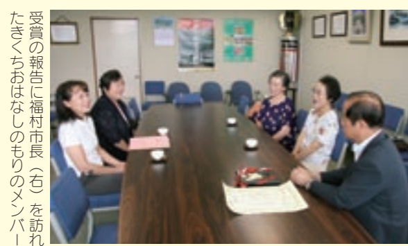
受賞の報告に福村市長（右）を訪ねたきくちおはなしのもりのメンバー