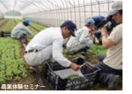
農業体験セミナー