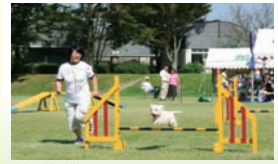
昨年の動物愛護祭り

ところ 熊本県農業公園 カントリーパーク(合志市) 入園料 300円(カントリーパーク入園料) ※高校生以下無料。 ※ペット同伴はできませんので、ご了承ください。 催し物(雨天の場合は一部変更があります)