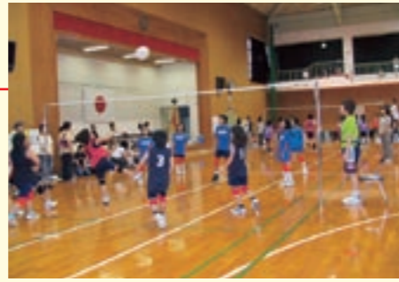
熱戦を繰り広げる選手たち

ビーチボールバレーとソフトボールの優勝チーム(オープン参加を除く)は、8月27日(日)に荒尾市である熊本県大会に出場します。市民の皆さんの応援をお願いします。