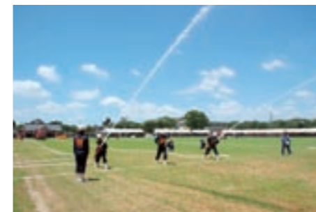
ポンプ車操法の2線放水

8月27日(日)に人吉市である「熊本県消防操法大会」に、菊池市支部の代表として、小型ポンプの部に本部機動隊(七城班)が、ポンプ車の部に第1分団が参加します。市民の皆さんの応援をお願いします。