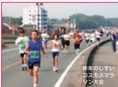
昨年のしすいコスモスマラソン大会

爽やかな秋風の中、色とりどりのコスモスが咲き誇る「しすいコスモスマラソン大会」の季節がやってきました。 この大会は「コスモス街道をマイペースで健康づくり」を大会スローガンに、合志川の堤防道路を自分のペースでゆっくり走る健康マラソンです。 市民の皆さんの参加をお待ちしています。 恒例の抽選会では、豪華賞品も多数用意しています。