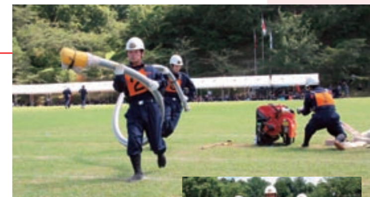
水利側で吸管を伸ばす2番員(左から1番目)と3番員(左から2番目)