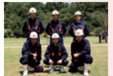
第1分団の選手たち