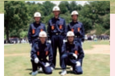
本部機動隊(七城班)の選手たち