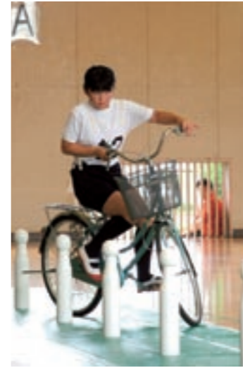
ピンを倒さないようにと真剣に競技(ジグザグ進行)に挑む参加者