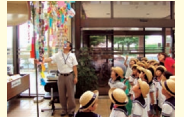
泗水総合支所に七夕飾りを届けた、泗水幼稚園の園児たち

寄贈された七夕飾りは、泗水総合支所庁舎玄関ホールに、7月26日(水)まで飾られました。