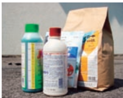
農業空容器(産業廃棄物)の回収にご協力ください

※回収袋には、住所・氏名・電話番号の記入を忘れないようにしてください。 ※回収袋は、JA資材店舗窓口で、1枚100円にて販売しています。