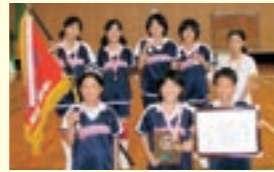
富の原北・東区子ども会