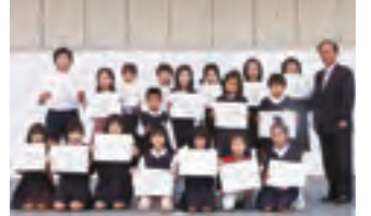
写真下：書道展で表彰された子どもたち