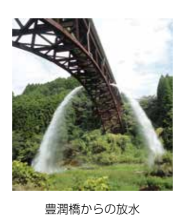
豊潤橋からの放水

とき 11月8日(日) 午前10時～午後1時30分 ところ 熊本再春荘病院多目的ホール 内容 健康講座「健康長寿とロコモティブシンドローム」・「お薬手帳の活用について」、実演・体験コーナー、健康相談コーナー、測定コーナー、キッズコーナー 入場料 無料 📞熊本再春荘病院管理課 ☎096(242)1000