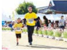
コスモスマラソン