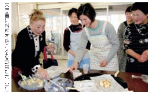
来庁者に料理を紹介する会員たち(右)

この日は菊池市役所のほかにも、菊池地域振興局、合志市役所合志庁舎、同西合志庁舎、大津町役場、菊陽町役場でも同じ取り組みがありました。