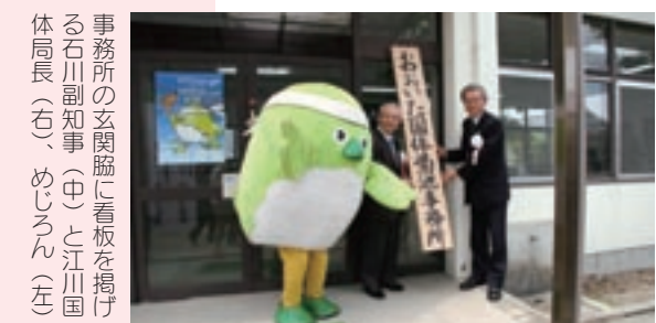
事務所の玄関脇に看板を掲げる石川副知事(中)と江川国体局長(右)、めじろん(左)

同所には、大分県国民体育大会・障害者スポーツ大会局の職員5人が常駐し、リハースル大会と本大会へ向けての計画づくりや準備作業などの業務が行われます。