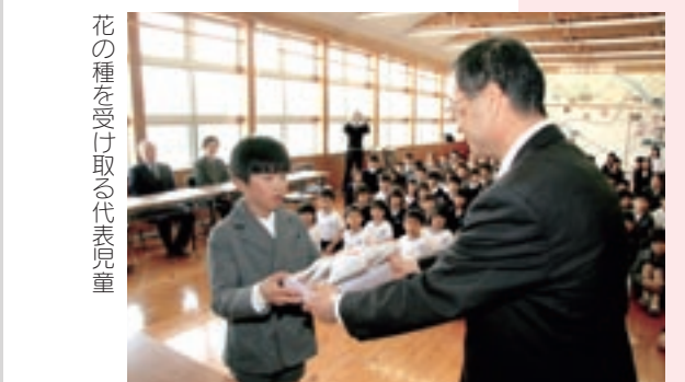
花の種を受け取る代表児童