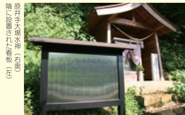
原井手大場水神(右奥)隣に設置された看板(左)

同委員会では「由緒ある水神さんなので、近くに来た際にはぜひ立ち寄ってもらい、たくさんの人にこの水神さんを知ってもらいたいです」とのことです。