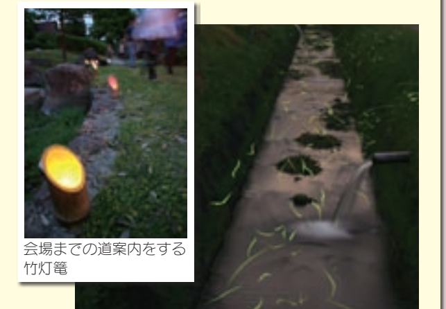
会場までの道案内をする竹灯籠 前川公園周辺の用水路を舞うホテル(5月9日午後8時撮影)

ホテルフェスタが七城町の前川公園とその周辺で2日間あり、たくさんの小・中学生や親子連れなどで賑わいました。 前川公園には、特産品のメロンや金魚すくいなどの夜店が並び、訪れた人を楽しませました。 また、駐車場の七城総合グラウンドから会場までの道路脇には、約700個の竹灯籠が並べられ、幻想的に道案内もしました。 同公園周辺の用水路や川では、日の暮れる午後7時30分ごろからたくさんのホテルが舞い始め、来場者の目を楽しませました。