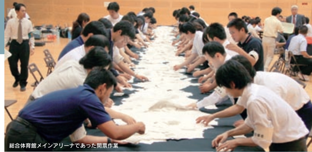
総合体育館メインアリーナであった開票作業