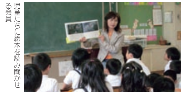
児童たちに絵本を読み聞かせる会員

生涯学習ボランティアの「かわはる空ちゃんクラブ」が、河原小学校で児童たちに絵本の読み聞かせを行いました。 同クラブの会員が、「あらしのよるに」などの絵本をやさしい声で読み聞かせると、児童たちは目を輝かせながら絵本の世界に引き込まれていました。 これは、菊池市が進めている「生涯学習ボランティア事業」で、地域でさまざまな特技を持っている人たちに、生涯学習ボランティアとして登録してもらい、菊池市内の小・中学校や地域の希望などに応じて活動しているものです。 同クラブも今年4月に登録した団体で、絵本・紙芝居の読み聞かせを中心にボランティア活動をしています。