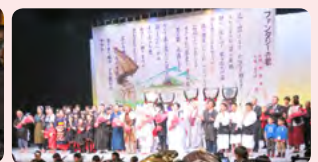
市民劇「遠野ファンタジー」観賞