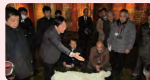
市内見学のようす