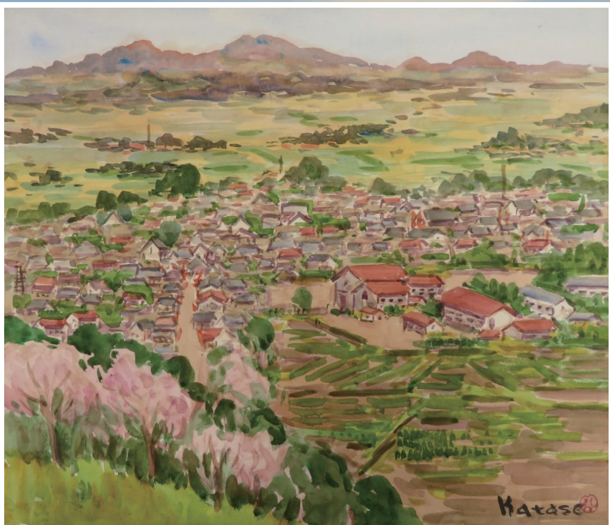
城山より見おろす 隈府町