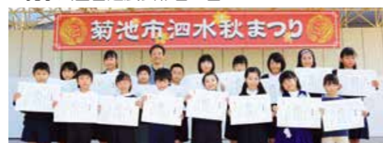
▼孔子公園書道展表彰者の皆さん