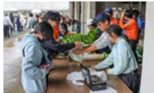
昨年の農場開放祭

2学期はたくさんさんのイベントが開催されています。 ● 現場実習・インターンシップ 9月・10月は2年生が現場実習やインターンシップを行いました。現場実習は県内の農家に4泊5日で実習に励み、インターンシップでは企業や事業所などで5日間の研修を行いました。学校では学べることができない貴重な体験です。 ● 全国農業クラブ全国大会西関東大会 10月下旬には全国農業クラブ全国大会西関東大会が開催され、本校からは県代表として7人の生徒が参加しました。 ● 菊農フェスタステージ発表 11月15日(土)は菊農フェスタステージ発表を実施します。各クラスの発表や生活文化科のファッションショーが行われます。 ● 農場開放祭 11月16日(日)は毎年大盛況の農場開放祭です。今年も生徒たちが心を込めて作り育てた農産物や製品を販売します。ぜひ来場ください。