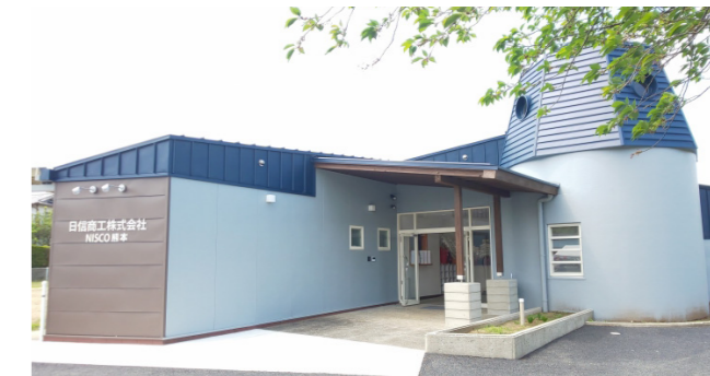
完成した日信商工(株)NISCO熊本。園舎をそのままリニューアルしています

市と進出協定を締結した半導体製造装置部品製造業の日信商工(株)が旧旭志幼稚園で、新工場建設に伴う竣工式を行いました。外観の園舎はそのまま生かし、各教室はクリーンルームや会議室にリニューアルされています。