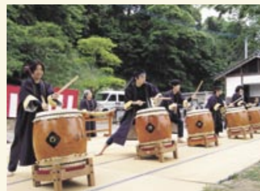
七城天守太鼓保存会の太鼓演奏

ホタルフェスタが七城町の熊本名水百選「前川水源」のある前川公園とその周辺で交流の場をつくることと自然環境保護運動の広がりを目指すを目的にあり、多くの親子連れなどで賑わいました。