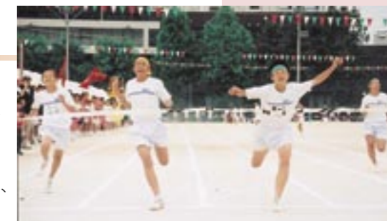
男子100mのゴール。生徒たちは「無限大の力」を発揮しました

生徒たちは、100mやリレー、ダンスなどに精一杯取り組み、保護者などからは盛んな声援が送られました。