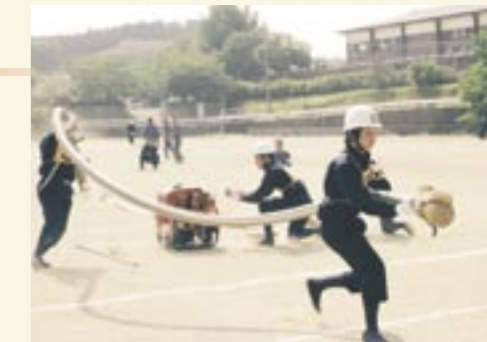
旭志方面隊の予選会