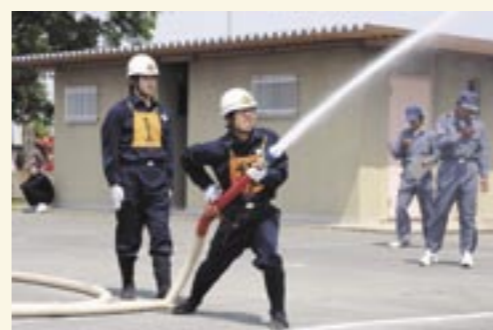
七城方面隊の予選会