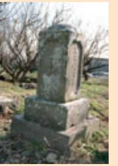
赤星因徹の遺髪墓

江戸時代の本因坊と井上家はほぼ同格の家元、特に本因坊文和と井上幻庵因碩の間では、棋界最高の権威である「名人碁所」の地位をめぐってしのぎを削っていました。この地位に就くには官命、四