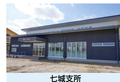
七城支所 七城町甲佐町74番地1 ☎0968(25)1000