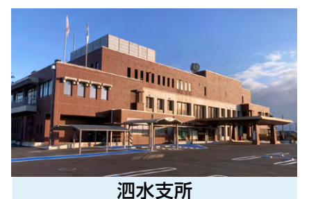
泗水支所 泗水町福本383番地 ☎0968(25)2001

各支所では各種証明書の発行や申請手続きを行います。泗水支所は庁舎内にこども健診センターを併設。七城、旭志支所は公民館に隣接しています。