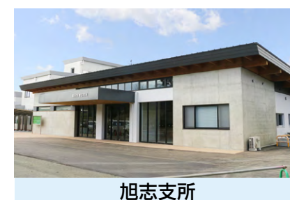
旭志支所 旭志小原240番地 ☎0968(25)3330