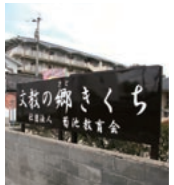
問い合わせ先 菊池教育会 ☎(25) 2316

「菊池教育会」は、元の「菊池教育団」から昨年12月に新たにスタートした社団法人です。教育支援や地域の振興発展を願って、各種事業に取り組んでいます。 これからの教育は学校だけの問題だけでなく、広く住民が参加することで、やってもらうのではなく、自分たちでやるものです。 そこで歴史ある誇り高き菊池文化を掘り起こし、学びあい、次の世代に繋ぐことが最も必要だと考え、専門講師を招いて5月から左記のとおり「菊池塾」を開講します。