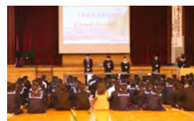
七城中学校で講演会

これまでの活動を通して学生の視点で調査・研究したものを、海外の人たちにもしっかり伝えていきたい」と抱負を述べました。 スマートアクティ部の活動が日本国内はもとより、世界の人々の幸せのために貢献できるよう今後も応援をお願いします。