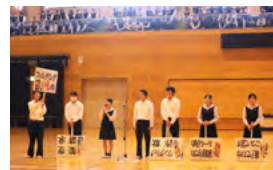
玉名市でのボウハンティア発表会