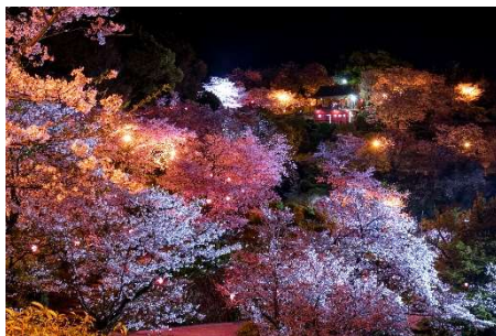
菊池公園のライトアップ 菊池神社の参道のレッドカーペット