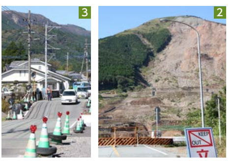
1_倒壊した拝殿(阿蘇神社) 2_崩落した阿蘇大橋と土砂崩れの跡(南阿蘇村) 3_地盤沈下で寸断された道路も現在は通行できる(阿蘇市)