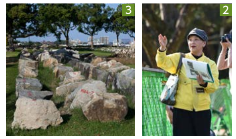
1_複数箇所ですり壊れた石垣(写真は戌亥櫓) 2_修復中の熊本城を案内するボランティアガイド 3_同じ位置に復元するため整理された崩れた石垣