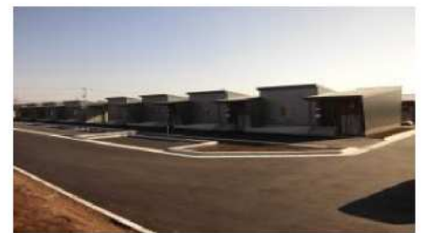
富の原団地(泗水地域)