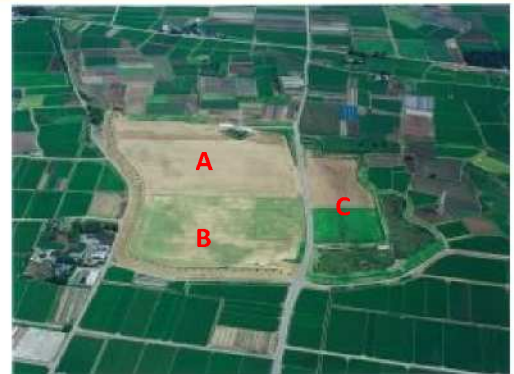
分譲中の田島工業団地(3区画)