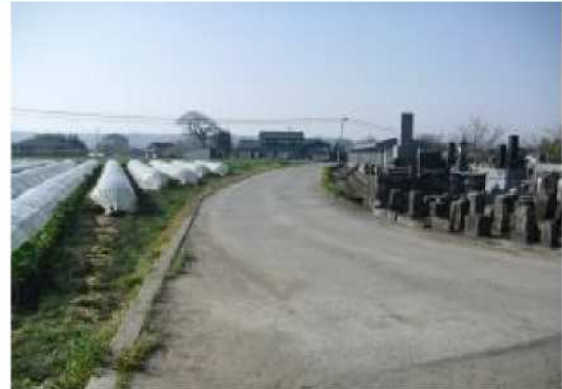
管渠工事布設箇所