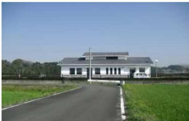
永住吉地区クリーンセンター

農業集落排水処理施設へ接続することにより、集落の生活排水及びし尿の処理を行い、農業用排水路の機能維持及び関係住民の生活改善を図るとともに公共用水域の水質改善に寄与します。