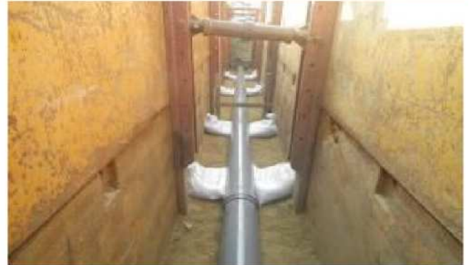
下水道管布設状況