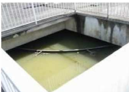
更新前のNO2最初沈殿池設備

改築更新事業が完了しますと、処理場の持続的な機能維持は勿論のこと、処理能力も向上し、確実に安定的な下水処理を続けることが可能となります。