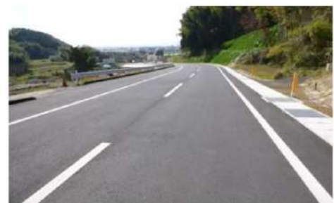
県道 日生野隈府線

地域住民の需要に対応できる幹線道路等の整備を行い、広域的なアクセス道路としての安全性や交通の利便性向上を図ります。