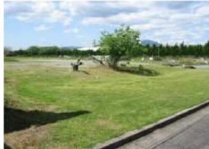
機械濃縮施設の増設予定地