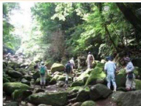
山間地の境界立会