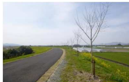
迫間川(七城町高田区)

植樹した桜を永続して管理していく中で、桜を郷土の遺産とし、市民の皆さんの郷土愛の醸成を図ります。また、「菊池ファン」を増加させることで、観光や経済の活性化につながります。