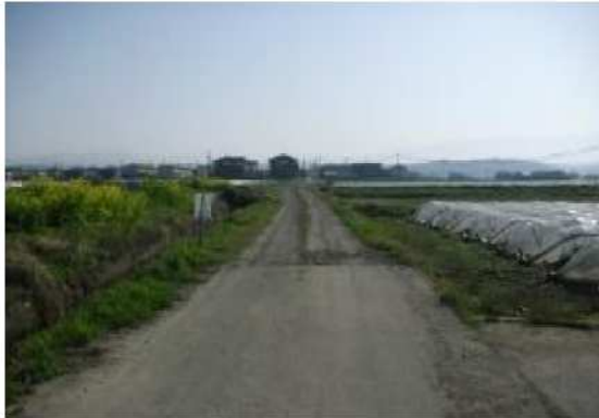
管渠工事布設箇所

未整備地区の管渠工事を行うことで、公共下水道へ接続することが可能となり、生活環境の改善と公共用水域の保全に寄与します。