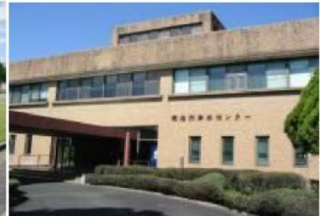
耐震診断調査を行う管理棟