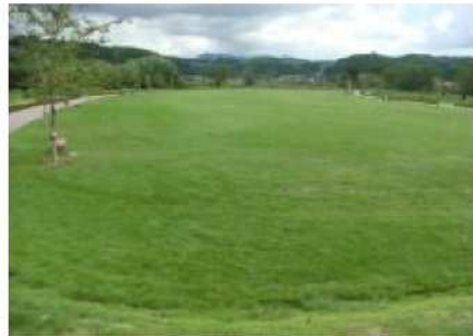
菊池ふれあい清流公園