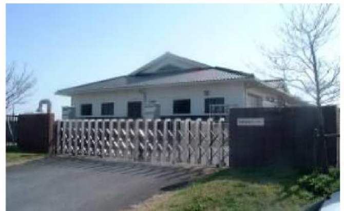
七城北部浄化センター