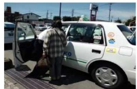
あいのリタクシーの様子

地域住民の生活交通の確保を行うことにより、通院や買い物の利便性が高くなります。また、外出頻度の増加が、市街地や町なかなどの活性化につながります。