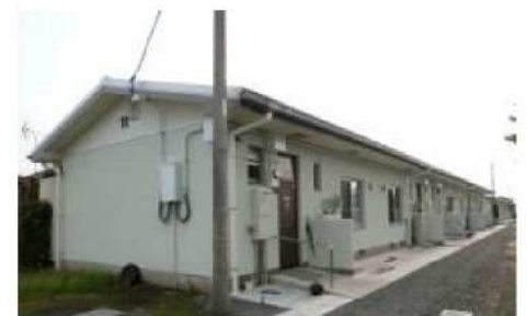
北宮団地(改修後の住宅)