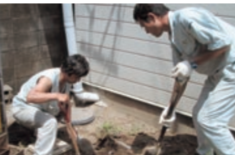
水道週間の一環で菊池市管工事組合と泗水町水道組合による奉仕活動

今回の作業では、すべてのメーターボックスを工事することはできませんでしたが、今後積極的に改善工事を行っていく予定です。 また、6月6日(月)には、菊池北小学校4年生の児童たちが