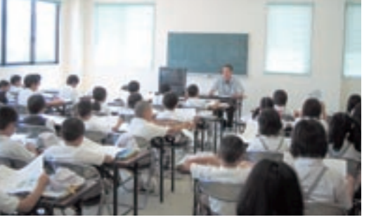
「水道水はどこからきているのか」や「水道局ではどんな仕事をしているのか」などを学ぶ児童たち

が水道局を訪れ、菊池市の水道について学習しました。 児童たちは、水道のしくみや水道局の役割について多くの質問をし、職員からの回答を一生懸命ノートに書き込んでいました。