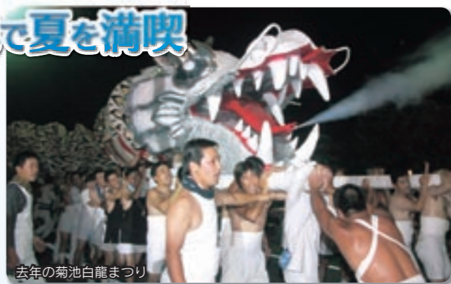
去年の菊池白龍まつり