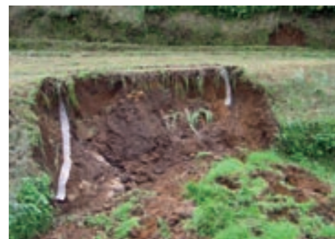
平成17年に起きた農地災害

※①・②どちらかの事業で復旧を希望する場合は、各区長さんの取りまとめになりますので、災害発生後3日以内に災害箇所の属する区長さんへ連絡してください。