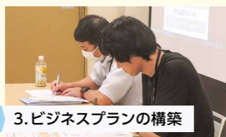
3. ビジネスプランの構築