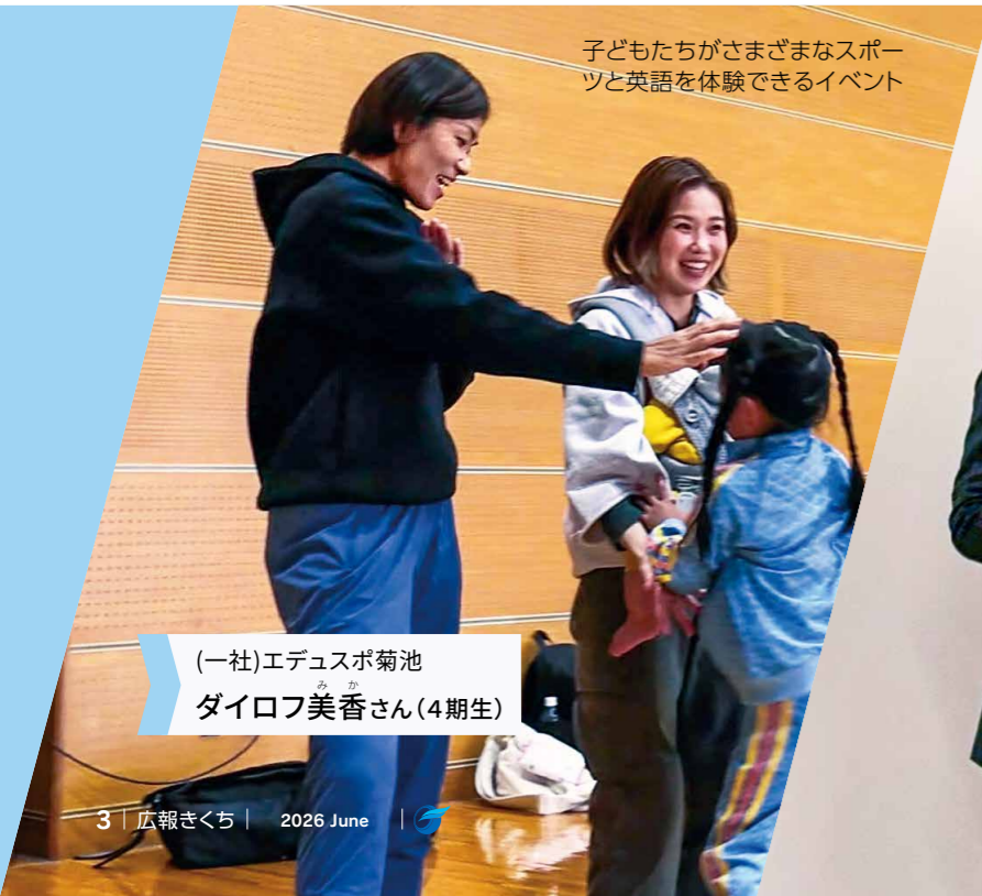
子どもたちがさまざまなスポーツと英語を体験できるイベント