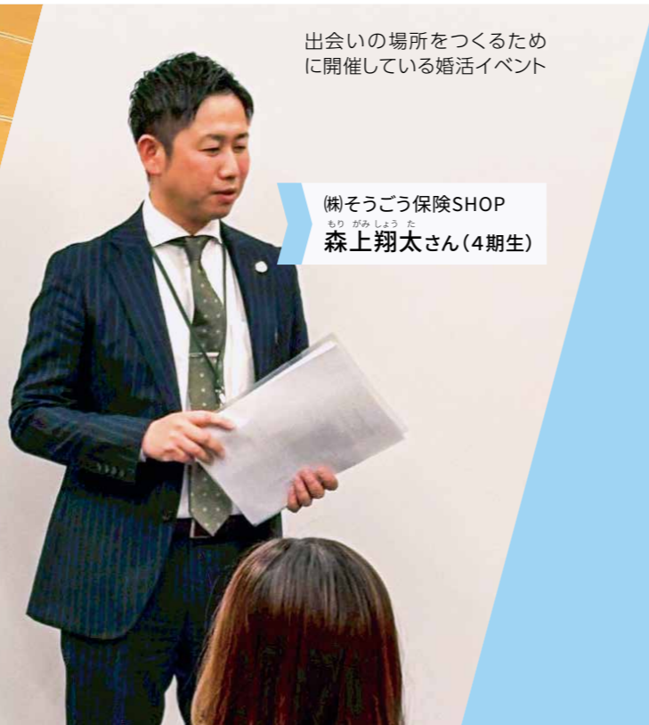
出会いの場所をつくるために開催している婚活イベント