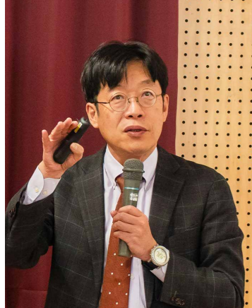
熊本大学 副学長・共創学環長 金岡省吾教授