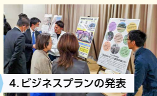
4. ビジネスプランの発表