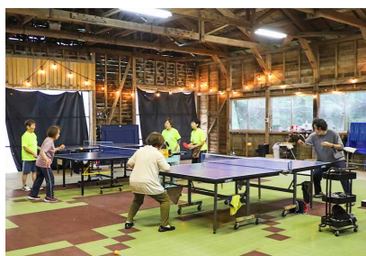
ラージボールは、ボールが卓球より大きく軽いため、世代問わず楽しめる競技

きくち未来創造塾を修了し、地域と企業の魅力を高めるために奔走する2人に話を聞きました。