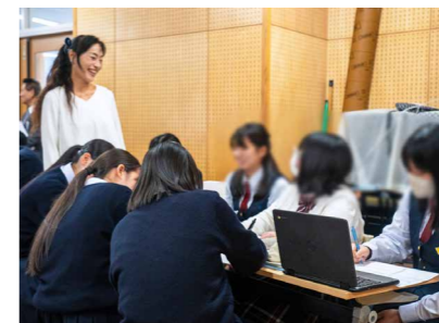
グループワークで積極的な意見交換を行う菊池女子高校の生徒たち