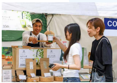
5月10日開催の菊池の恵みフェスティバルに出店し、モリンガ茶を販売

モリンガはとても健康に良い植物です。このモリンガを軸に、農業、福祉、健康、地域をつなぎ、目の前の人の笑顔が少しずつ広がっていくような循環をつくりたいと思っています。その一歩となるコミュニティカフェを構想中です。自然と人が集まり、いろいろなつながりが生まれ、地域を元気にできる場所にしていきたいです。