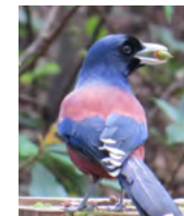
龍郷町に生息するルリカケス

市では毎年2月に市内の道の駅や物産館で奄美フェアを開催。一部商品は常時取り扱っています。世界遺産登録の記念に、奄美の特産物にぜひ触れてみてください。