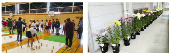
児童たちは交流をとおして地域とつながり、さまざまな体験ができています。地域に見守られながら成長していることに感謝します

6年生が地域の人たちとモルックで交流を深めました。市社会体育課やスポーツ推進委員協議会から指導に来てもらい、最後までチームで協力しながら楽しむことができました。また、3年生は深川フラワーズの皆さんと菊作りに挑戦。大輪の美しい菊を咲かせることができ、みんな感動していました。