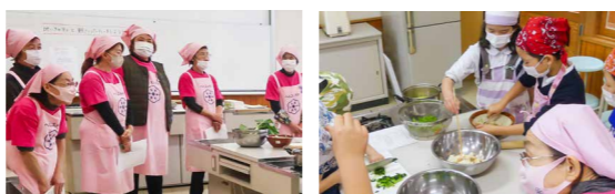
6人の食生活改善推進員の皆さんに優しく教えてもらいました。とてもおいしかったです。ありがとうございました

2年生が学級園で育てた野菜(カブ、コマツナなど)を収穫しました。「野菜パーティーをしたい」という児童たちの希望で、地域の食生活改善推進員の皆さんと「カブの納豆和え」と「冬野菜の胡麻和え」に挑戦。たくさんの愛情を込めて育てた野菜と地域の皆さんの温かさが詰まった料理の味は最高でした。