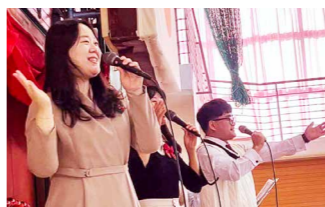
オンギジャンイの皆さん

後半の交流会では、生徒が振り袖の着付けやお点前、日本剣道形、バトン演技を披露した他、韓国語で行ったスキットの発表を見て、メンバーの皆さんはとも喜んでいました。