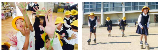
地域の人からは「懐かしさやうれしさが生まれ、幸せな時間でした」「感想文はわが家の宝にします」など、うれしい感想がありました

1・2年生が、地域の人と交流する「ふれあいタイム」ではおはじきやけん玉など、10種類の昔遊びを体験しました。見事な秋晴れの下、笑顔の花も満開。児童からは「教えてもらってうれしかった」「また遊びに来てください」といった感謝の言葉が並び、地元の温かさに触れた素敵な時間となりました。