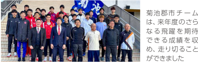
菊池郡市チームは、来年度のさらなる飛躍を期待できる成績を取り、走り切ることができました