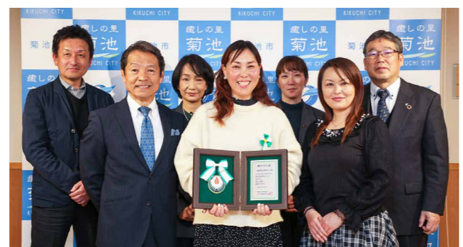
菊池南中学校PTAは平成18年から校内行事で劇を披露する活動を続けています

県内で環境美化や社会奉仕などに取り組む団体や個人をたたえる「熊日緑のリボン賞」を菊池南中PTAが受賞。校内行事で人権劇を披露し、生徒に向けて差別やいじめの解消、人権の大切さを訴えたことが評価されました。