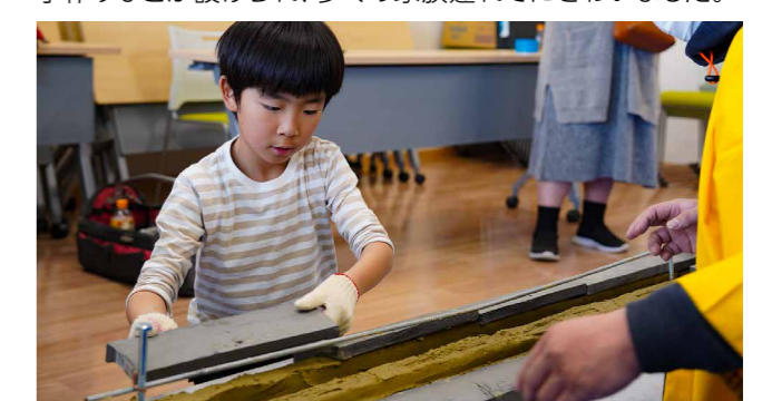
子どもたちはそれぞれの職人に直接教えてもらいながら仕事の難しさや面白さを体験しました

子どもたちに体験を通してものづくりに興味を持ってもらおうと、中央公民館で技能フェア(主催:県、県職業能力開発協会、県技能士会連合会)が開かれました。キャンドルや椅子作りなどが設けられ、多くの家族連れでにぎわいました。