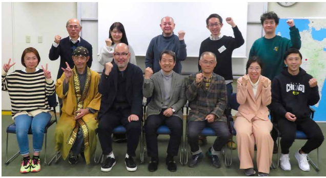
13回にわたる講義やヒアリングなどを経て、最終回を迎えた3期生の皆さん

市内で起業を考えている人が必要なスキルを学び、事業計画書作成を支援する「きくち起業塾」が閉校しました。最終回では9人の塾生が飲食・整体・宿泊業など、自身が目指す起業について計画したプランを発表しました(関連24頁)。