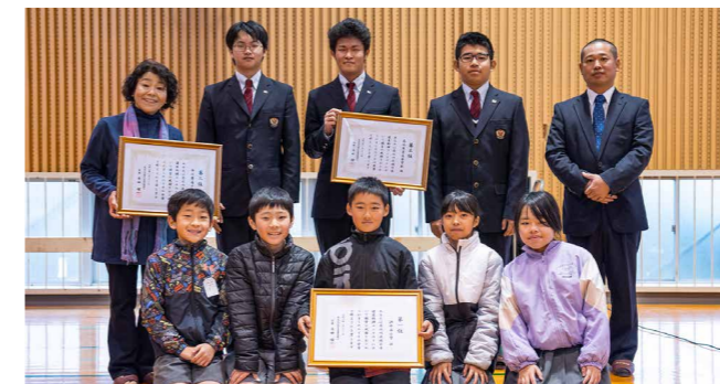
市内入賞団体の結果は次のとおりです。1位:泗水西小学校 2位:菊池市米飯官能鑑定士 柿の葉庵チーム 3位:菊池農業高等学校

菊池、山鹿、玉名、和水の3市1町などで作る菊池川流域日本遺産協議会が、昨年11月に流域の食材をPRする料理コンテストを初めて開催しました。応募レシピをまとめた冊子は各市町の役所や物産館などに設置しています。