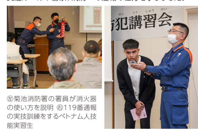
⑤菊池消防署の署員が消火器の使い方を説明 ⑥119番通報の実技訓練をするベトナム人技能実習生

市在住の外国人を対象にした防災、防犯講習会(主催:菊池国際交流協会、市立図書館)が中央公民館でありました。ベトナムやインドネシアなどの技能実習生約40人が日本の交通ルールや警察、消防への通報の仕方を学びました。