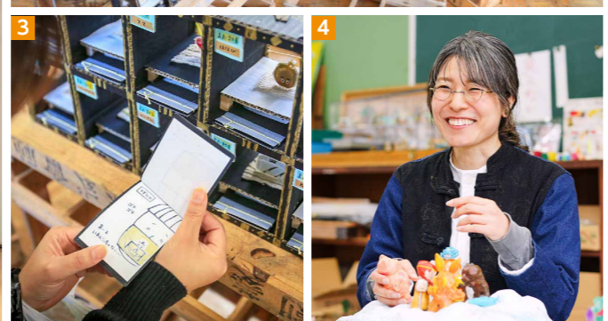
1_「今日も『あなぐまち』で生きていく」と並ぶ、つんさん 2_ 普段は団地ごとに床置きして、中を見ることが出来る 3_ 部屋には住人のことを説明する「住民名簿」が備え付けられている 4_ 「周りの人たちに喜んでもらったことが1番うれしい」と受賞の喜びを語った