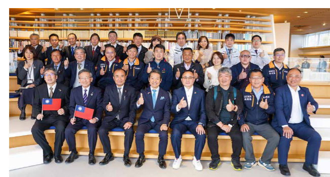
宝山郷の皆さんは菊池市長や市議会議員と意見交換を行った後、中央図書館を見学しました

台湾新竹県宝山郷の邱振璋郷長(首長)と行政や企業関係者が菊池市を表敬訪問しました。宝山郷には、台湾積体回路製造(TSMC)の本社がある工業団地があります。今回は菊陽町のTSMC新工場見学後、来菊したものです。