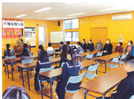
先輩の話をみんな熱心に聞いていました

6年生は「3年後の自分へ」、中学3年生は保護者宛てに「感謝の言葉」を書いたり、「中学校で頑張ること」や「将来の夢」について一人一人発表してもらったりしました。