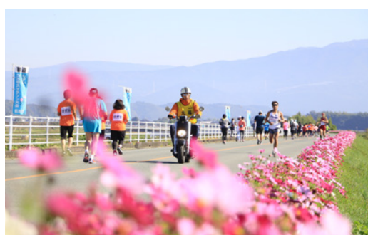
しずいコスモスマラソン大会

ニュースポーツの出前講座を行っています。さまざまなニュースポーツを楽しく一緒に体験しませんか。申込方法や詳細は、社会体育課までお問い合わせください。