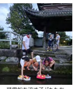
精霊船を流す子どもたち

時代の流れとともに、子どもの数が減少し、下赤星区では「もぐらうち」などの伝統行事ができなくなってきました。しかしそんな中でも、子どもたちが地域とともにあるようにと、近年、新しく始めた行事もあります。その一つが、10年ほど前から行われている「精霊流し」です。今年は新型コロナウイルスの流行によりさまざまな行事が中止になりましたが、感染対策を十分に行った上で精霊流しを行いました。