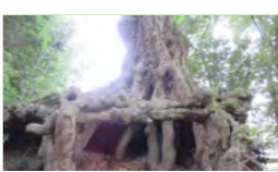
いちいがし(村吉区)

どの史跡も大変素晴らしく、感動させられました。菊池一族に関する史跡では、歴史の中の「菊池」の大きさを認識し、石碑や寺院からは、先人の偉業に心動かされました。千畳河原やびわ池、いちいがしを見て自然の力に驚き、花房飛行場跡では、平和への思いを改めて強く持つことができました。また、それらを守り続けてきた人々の営みに頭が下がる思いがしました。参加者からは、「菊池に生まれ育った人間でありながら、伝統・文化・歴史について勉強不足を痛感した。子どもたちはもとより、大人に対しても周知していく価値がある」「史跡の維持管理や案内などを充実させ、守っていく必要がある」などの感想や