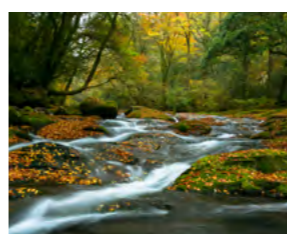
菊池渓谷(広河原)紅葉の風景

②史跡めぐりDVD作成 今年度の史跡めぐりで予定していた限りの史跡十カ所をDVDに収め、小中学校に配布します。ふるさと菊池への関心と誇りを育む一助になればと考えています。