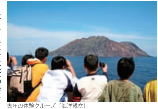
去年の体験クルーズ「海洋観察」