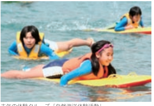
去年の体験クルーズ「自然海洋体験活動」

4、5、6年生または中学生心身ともに健康で、船内生活、レクリエーションなどを含む研修活動および船内などにおける団体行動が可能なる人（参加に際し、後日医師の健康診断書を提出いただきます） 使用客船 ふじ丸（2017、2018年）（予定） 実施内容 海洋観察、操舵室機械室見学、洋上星空観察、ホエールウォッチング、自然海洋体験活動ほか 問い合わせ先 社会体育課