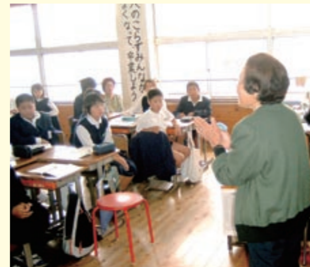
6年生の授業で話をするゲストティーチャー

この日は、七城高齢者大学の受講生も参観し、児童と給食を一緒に楽しみながら交流をしました。