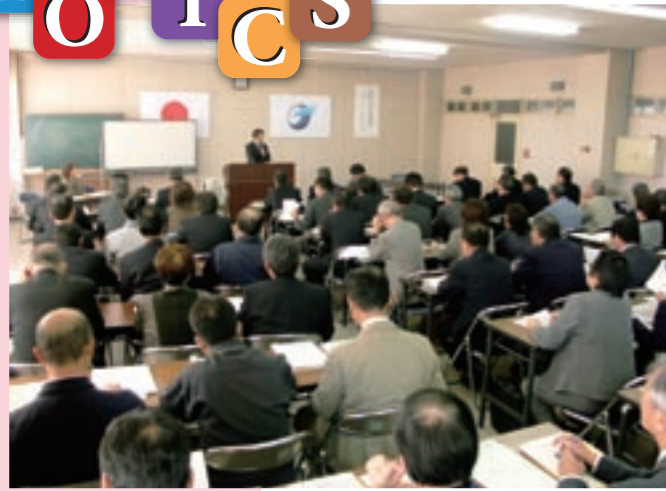
市行政改革推進室主催であった「行政改革に関する研修会」