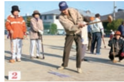
グラウンドゴルフ競技