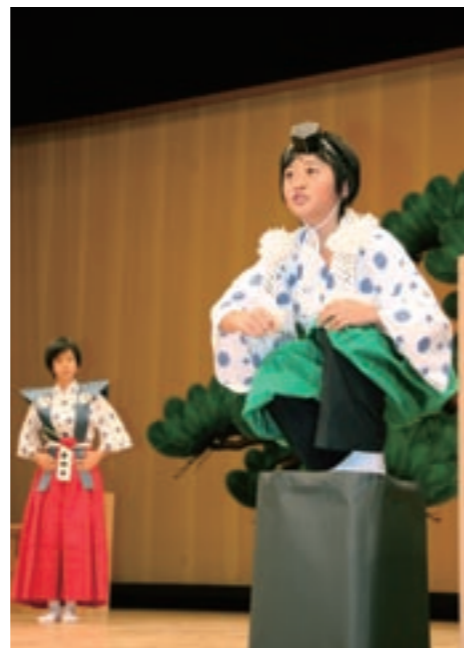
菊池北小学校の「狂言」