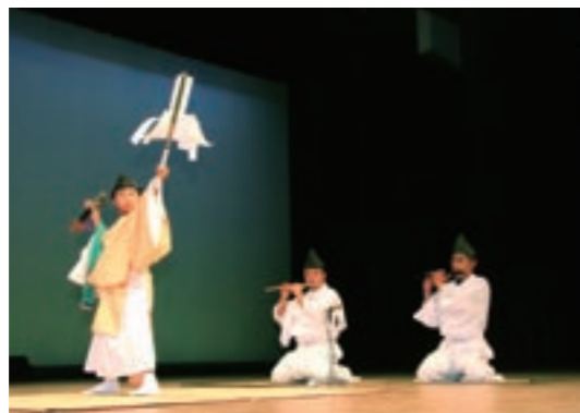
戸崎小学校の「赤星子ども神楽」