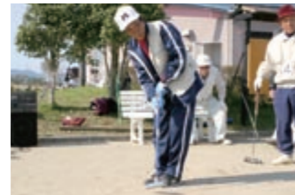
ゲートボール競技