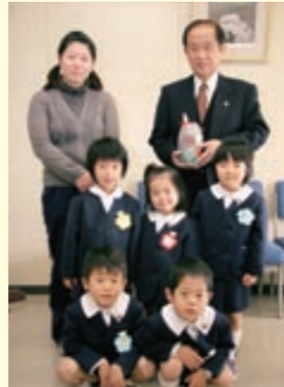
手作りの花びんを届けた代表の園児たち

この活動は、毎年この時期に合わせて同幼稚園が行っているもので、菊池市役所の各機関や菊池警察署、北消防署、菊池郵便局など20数カ所に届けられました。