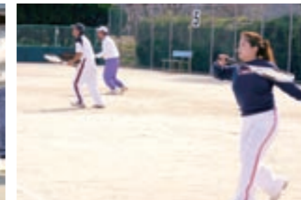
ソフトテニス競技