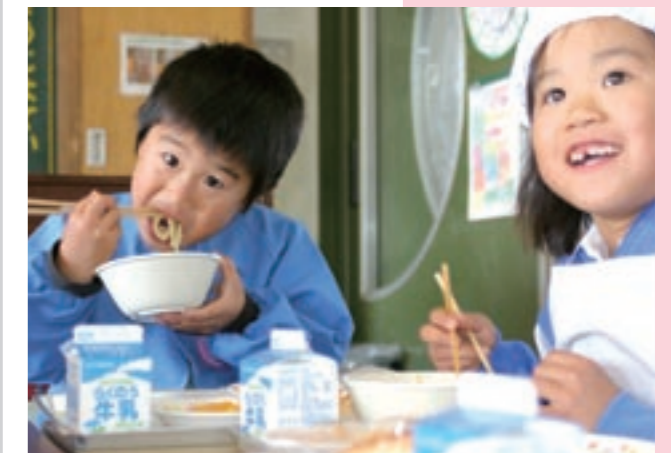
七城小学校で給食体験をする園児(左)