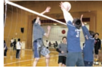
ソフトバレー競技