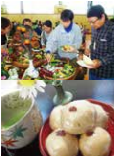
昨年の文化祭では菊池地域の家庭料理56種類が大集合