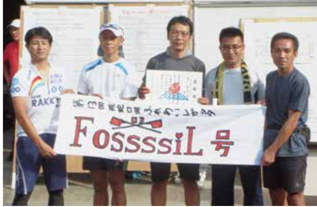
男子・男女混合の部で優勝したフォッシルチーム