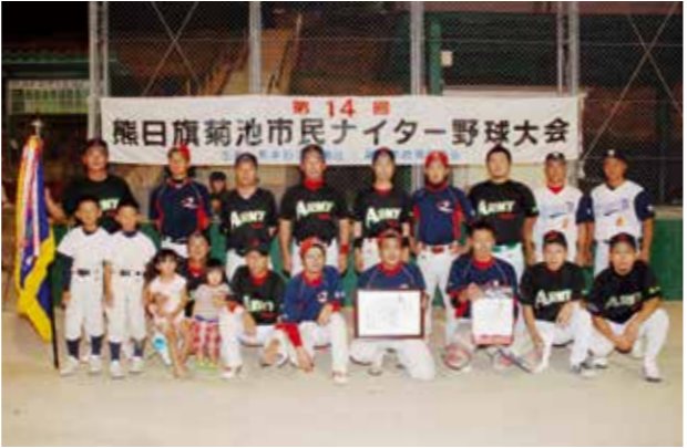
優勝した川口瓦工業所