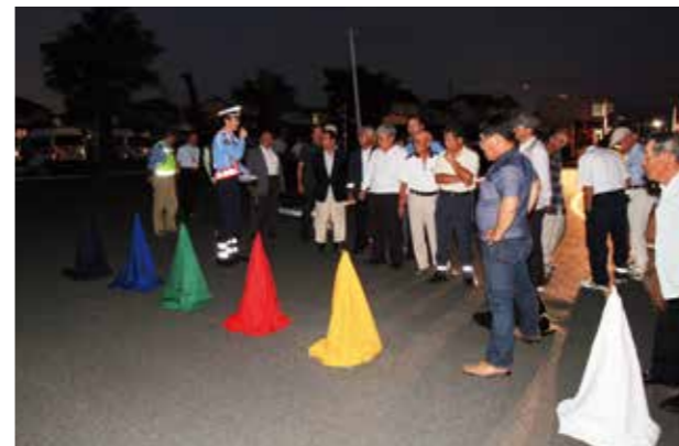
菊池警察署職員から目立つ色の説明を聞く参加者の皆さん

高齢者交通安全教室は菊池市自動車学校で開催され、市内の老人会など約30人が参加しました。この教室は、秋の交通安全運動の一環として行われたもので菊池警察署との共催。参加者の皆さんは、夜間の交通事故防止を訴えるビデオの鑑賞後、屋外で実際の体験をとおして目立つ色の違いや反射材の効果などを学びました。参加者からは、「目立つ色の違いがはっきり分かった」「やっぱり反射材は大事ですね」などの声を聞くことができました。