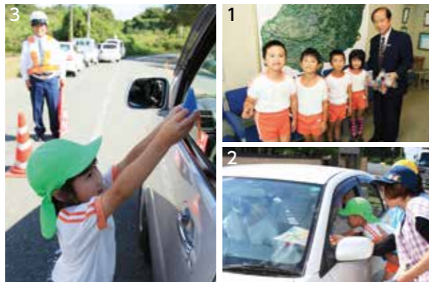
1. 交通安全のお守りを持って市役所を訪れた園児たち 2.3. ドライバーの皆さんにお守りを配りました

その後園児たちは、菊池警察署の協力のもと、国道387号沿いでドライバーにお守りを配布。元気いっぱい安全運転を呼び掛けていました。