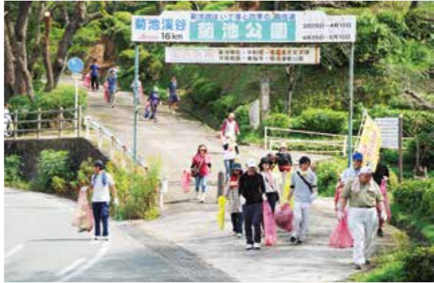
たくさんの人が清掃活動に参加しました

参加者の皆さんのおかげで城山公園が美しくなり、春には綺麗な桜が見られそうです。暑い中大変お疲れ様でした。