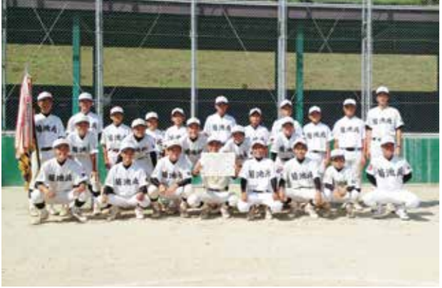
優勝した菊池北中学校野球部