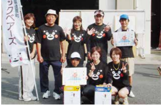
女子の部で優勝したロックベアーズチーム