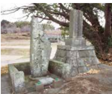
認定番号第ふるさとH23-12号 推薦者 戸豊水区

由来碑には、古川兵吾井手開設の経緯、経過を詳細に記してあり、この井手の維持管理に務め、今ある恩恵を忘れず、後世に伝えて行くよう記されています。両碑とも今もなお流域の水田を潤し、生活用水、非常用水として利用されている古川兵吾井手の歴史を語る地域の宝です。