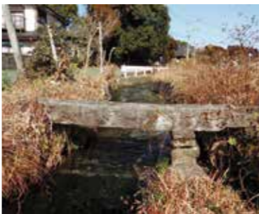
認定番号第ふるさとH23-11号 推薦者 古川兵吾井手管理委員会

大平地区の急速な潤いをみた戸豊水地区でも、農業用水確保のため井手の延長を計画。しかし菊池川の水だけでは不足するため、上津江村の川原川から途中6力所の隧道を要する兵藤井手を掘り、鉾甲川を経て古川井手を増水し、戸豊水地区まで井手を延ばすことができました。兵藤から戸豊水までの井手であることから頭文字を生かして「古川兵吾井手」と呼ばれ、現在でも多くの水田を潤しています。