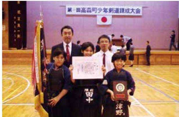
優勝した隈府小剣道部