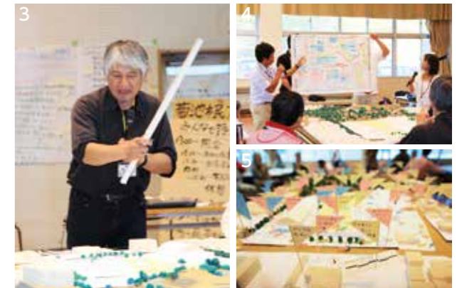
2. 市民広場周辺や市街地を散策 3. 九州大学大学院芸術工学研究院