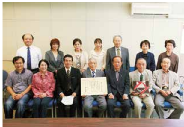
受賞した妻籠座の皆さん

原座長は、「人生の先輩として、これまでの先輩たちに負けないよう活動していけたらと思っています。『人生最後まで勉強』です。新しい座員も増えました。これからも、楽しくやっていきます」と喜びを語りました。