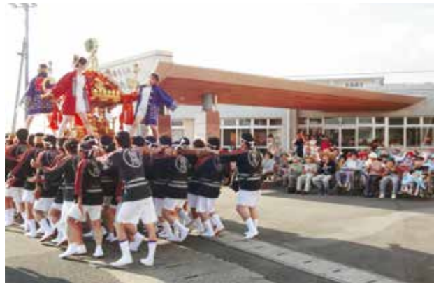
神輿担ぎを披露する消防団員に拍手を送る施設利用者の皆さん

菊池市消防団がこすもす荘・ふじのわ荘・つまごめ荘を慰問し、神輿担ぎを披露しました。これは普段祭りを見ることができない老人福祉施設に入所している高齢者の皆さんのために、消防団が毎年行っているものです。慰問には消防団員約120人が参加。消防法被を身にまとった団員たちが、威勢の良い掛け声とともに神輿を担ぐ姿に、施設利用者の皆さんと一緒に掛け声や拍手で応援しながらお祭り気分を楽しんでいました。