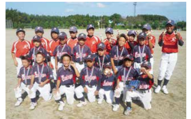
優勝した泗水ウエストレイズ

本大会は小学4年生以下の子どもたちの大会で、日ごろ応援などで試合に出場する機会の少ない子どもたちが出場。好プレーや珍プレーが続出し、会場内で応援する保護者も笑顔が絶えませんでした。大会は、泗水ウエストレイズが優勝しました。