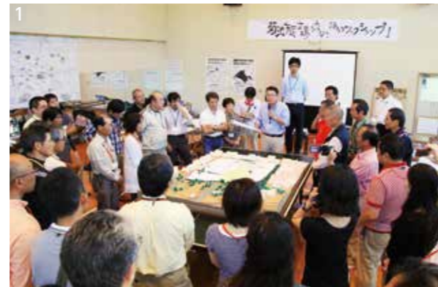
1.4.5. ワークショップではさまざまな意見が交わされました。2. 市民広場周辺や市街地を散策 3. 九州大学大学院芸術工学研究院の藤原恵洋教授もアドバイザーとしてワークショップに参加

菊池市民広場の未来を語り合うワークショップが青少年ホームで開催され、二日間で延べ90人の市民が参加しました。1回目は広場周辺や市街地を散策して感想などを持ち寄り、2回目は前回の内容をもとにそれぞれの意見を集約。「食事ができる施設が必要」「音楽などを披露する場があれば」「子どもが遊べる遊具がほしい」などさまざまな意見を出し合いました。今回のワークショップの内容は、再整備協議会で整理し本市へ提案される予定です。