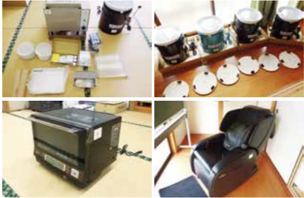
荒牧区自治会に整備された備品

このコミュニティ助成事業は、社会貢献広報事業費を財源として財団法人自治総合センターが助成決定を行うもので、今後、荒牧区自治会の益々の活性化が期待されます。