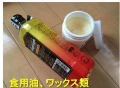
食用油、ワックス類