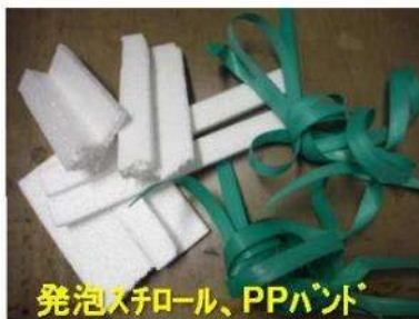
発泡スチロール、PPバンド