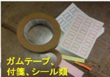
ガムテープ、 付箋、シール類