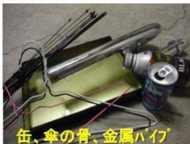
缶、傘の骨、金属パイプ