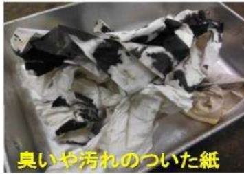
臭いや汚れのついた紙