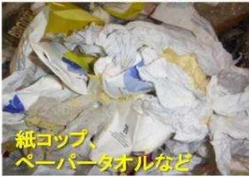
紙コップ、 ペーパータオルなど