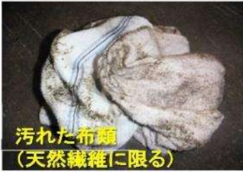
汚れた布類 （天然繊維に限る）