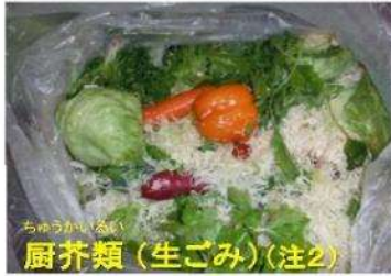
ちゅうかいるい 厨芥類（生ごみ）（注2）