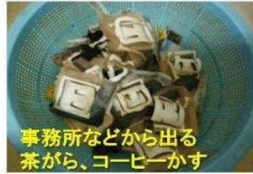
事務所などから出る 茶がら、コーヒーかす