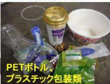
PETボトル、 プラスチック包装類