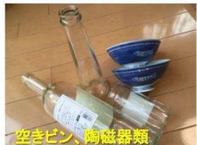
空きビン、陶磁器類