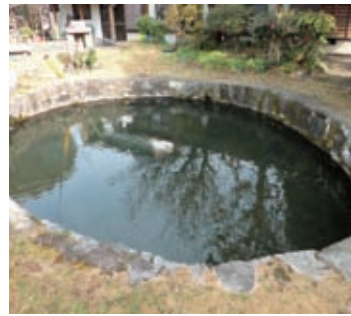
認定番号第ふるさとH23-4号 推薦者 大塚区

大塚区域には、昔から出水さん、底無し川(池)と呼ばれ親しまれている二つの湧水池があり、昔も今も変わることなく湧水を続けています。 出水さんから流れ出る清水は、昭和の半ばまで生活用水として夏は冷たく、冬は温かい水として区内全家庭の池を満たしていました。しかし、今では一部に残る石造りの水路跡や池跡に垣間見るだけとなっています。 湧水池の辺りには水神さんの石廟・石像が祀られ、また無底井、池巻縁起の石碑があります。川祭りの祭事や草刈などを通して、行事と景観保全の伝承が行われています。