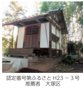
認定番号第ふるさとH23-3号 推薦者 大塚区

大塚区の西側には、竹林に覆われた古墳があり、菊池川流域には数多くの古代遺跡や古墳群が点在していることから、ここも有力な豪族の墓と伝えられています。その頂に金比羅宮があり、社殿脇に王塚石碑、弁財天石廟、自然石2個が祀られています。 菱形の王塚石碑は江戸時代以前に建立された「地域の王」が眠っている古墳を表す石碑と推測され、大塚の地名の元ともなった貴重な石碑だとも伝えられています。弁財天石廟には、女神が琵琶を奏する姿の石像が祀られ、2個の自然石は、良縁結び、子孫繁栄を願うための信仰心を表したのではないかと伝えられています。