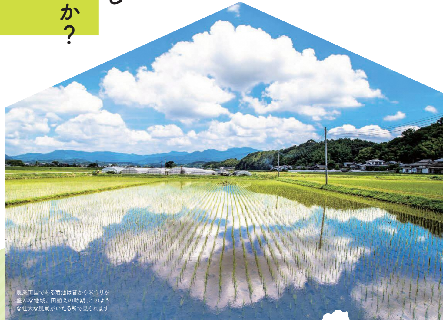
農業王国である菊池は昔から米作りが盛んな地域。田植えの時期、このような壮大な風景がいたる所で見られます