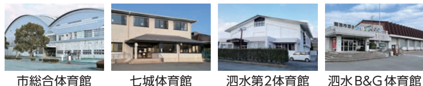
市総合体育館 七城体育館 泗水第2体育館 泗水B&G体育館