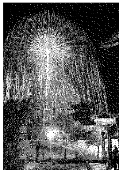
しすい孔子公園夏まつり