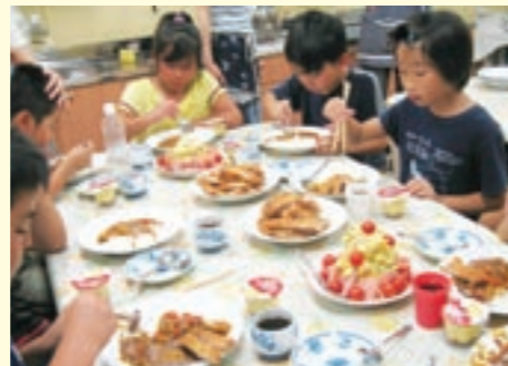
協力して作った料理を食べる児童たち