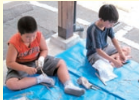
自分専用の箸づくりに挑戦する児童たち

夕食後の入浴は、6軒の高齢者のお宅にお世話になり、初めての「もらい風呂」体験をしました。「何となつかしい言葉でしょうか。今改めて昔むかしの子どもの頃を思い出させてくださいました。」という手紙や「またきてね。待っとるよ」というありがたい言葉も皆さんから頂きました。児童も地域の皆さんの温かさにふれ、嬉しかったことを伝え合っていました。保護者からは「夕食づくりの手伝いをしてくれるようになりました。成長したように思います」など、貴重な体験ができてよかったという感想がたくさん聞かれました。