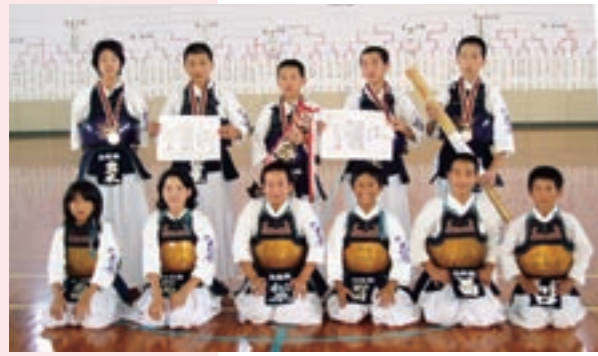
3位入賞した菊池白龍館Aチーム